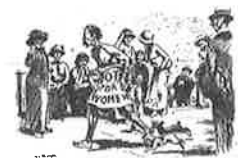
DE WELKEST STADEN DER SUFFRAGETTES 178. HOE HET 'S' STANDAARD DE MAATSCHAPPELIJKE WEG TOEGEEFT EN HOE HET BUREAUCRAAT VOOR DE WEG

(foto links) De Amsterdanner , 29 maart 1914, 11. (foto rechts) De Amsterdanner , 3 augustus 1913, 5.