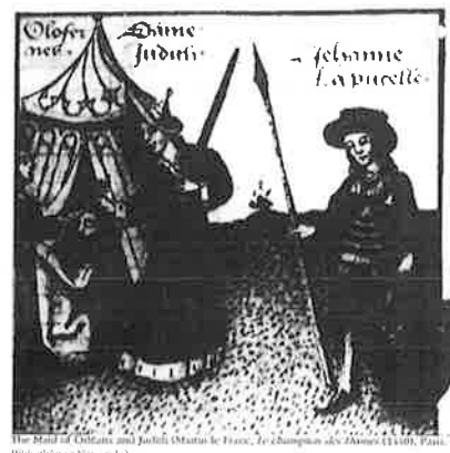
The Maid of Orleans and Justice (Marian de France, 1522) from the book 'The Maid of Orleans' by Jean de Dinteville, Paris: Bibliothèque Nationale.