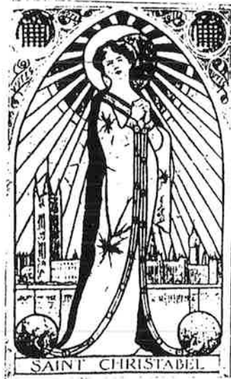
De Amsterdammer, 14 april 1912, 5.

Julie Houben is afgestudeerd in vrouwenstudies en cultuurgeschiedenis van de twintigste eeuw