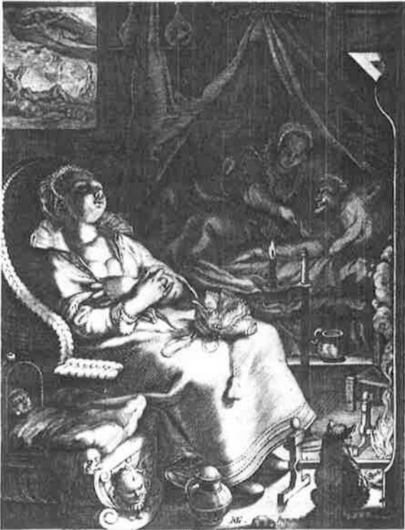
* Niete vacant cura animi placidum quietam Pessimum, gratia indulgent omnia ferunt. C. Schepius

Een in slaap gevallen min (gemaakt tussen 1600-1650) Gravure van Jan Saenredam naar Hendrik Goltzius