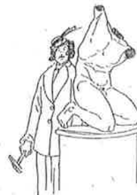
— Jammer, ik kom te laat. Een geestverwante is me vóór geweest.